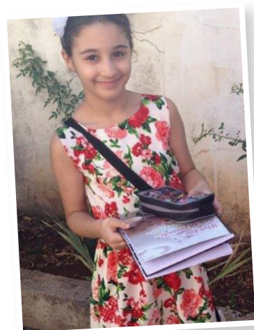
Ausgabe von Schulmaterial finanziert durch die Schwestern vom Guten Hirten in Homs und Damaskus.

Für Ihren Beitrag, der den Schulkindern ein Stück Stabilität und Hoffnung für die Zukunft schenkt, danken wir sehr!