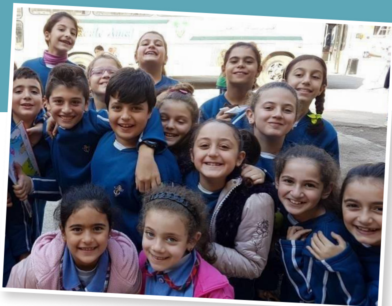
Die St. Vincent von Paul Vereinigung führt mehrere Schulen in Aleppo. Im Bild sind Schulkinder der Al Amal Schule zu sehen.

Acht kirchliche Partner (u.a. die Maristenbrüder und die St. Vincent von Paul Vereinigung in Aleppo sowie die Griechisch-katholische Erzdiözese von Homs, Hama und Ybroud) unterstützen so landesweit insgesamt 6.775 vom Bürgerkrieg betroffene Familien und ihre Kinder .