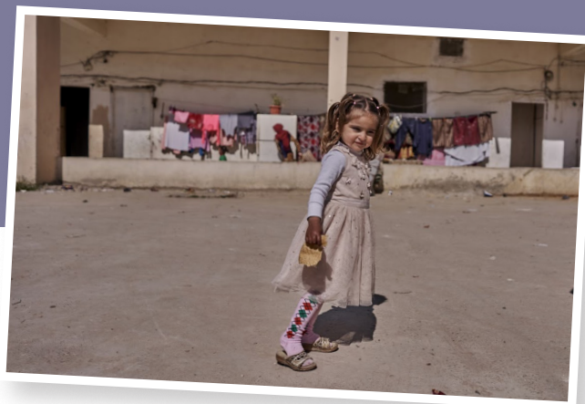
Die Kinder, die die Tage in den Notunterkünften ohne Aufsicht und Betreuung verbracht haben, sind dankbar für den geregelten Tagesablauf und die Struktur in ihrem Alltag, die ihnen durch die Teilnahme am Fratelli Project ermöglicht wird.

Mit dieser interkongregationalen Zusammenarbeit unter dem Namen „ Fratelli Project “ (Projekt der Brüder) möchten die Ordensleute den Geflohenen, insbesondere den Kindern, psychosoziale Unterstützung geben und den Zugang zu schulischer und sozialer Bildung ermöglichen . Insgesamt werden mehr als 1.000 Kinder aus Syrien, dem Irak aber auch bedürftige Kinder aus dem Libanon durch folgende Bildungs- und Freizeitangebote erreicht: