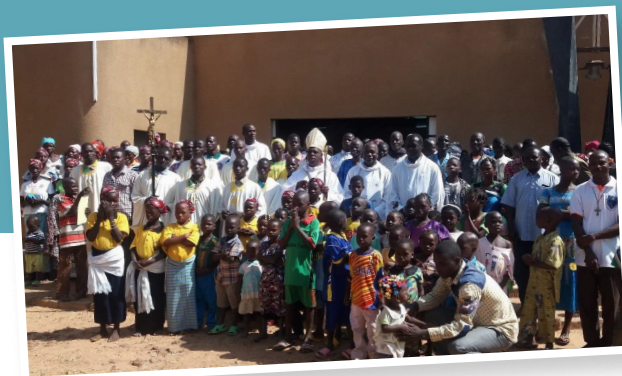
Titelfoto: Katechistenehepaare bei den Feierlichkeiten anlässlich ihres Abschlusses im Jahr 2019 am CFC Bam. Ihre Ausbildung konnte auch mit Hilfe von missio München gefördert werden.